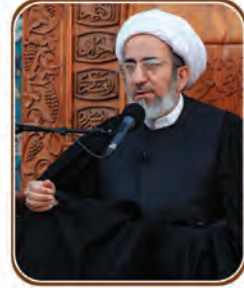
الشيخ حبيب الخاطمي

أكد المشرع الحكيم على طهارة البدن والساتر والأرض في حال الصلاة، التي هي أرقى صور العبودية للحق المتعال، كما يفهم من خلال جعلها عموداً للدين ومعراجاً للمؤمن، ولعل الأقرب إلى تحقيق روح الصلاة، هو الاهتمام بتحقيق الطهارة (الداخلية) في جميع أبعاد الوجود، بل هجران الرجز لا تركه فحسب لقوله تعالى: (وَالرُّجْزَ فَاهْجُرْ).. فالهجران نوع قطيعة مترتبة على بغض المهجور المنافر لطبع المقاطع له.. فالمتدنس (بباطنه) لا يستحق مواجهة الحق وإن تطهر بظاهره، حيث أن المتدنس - جهلاً وقصوراً - لا يؤذن له باللقاء وإن أعذر في فعله.. كما أن المتدنس (بظاهره) لا يؤذن له بمواجهة السلطان، وإن كان جاهلاً بقذارته .